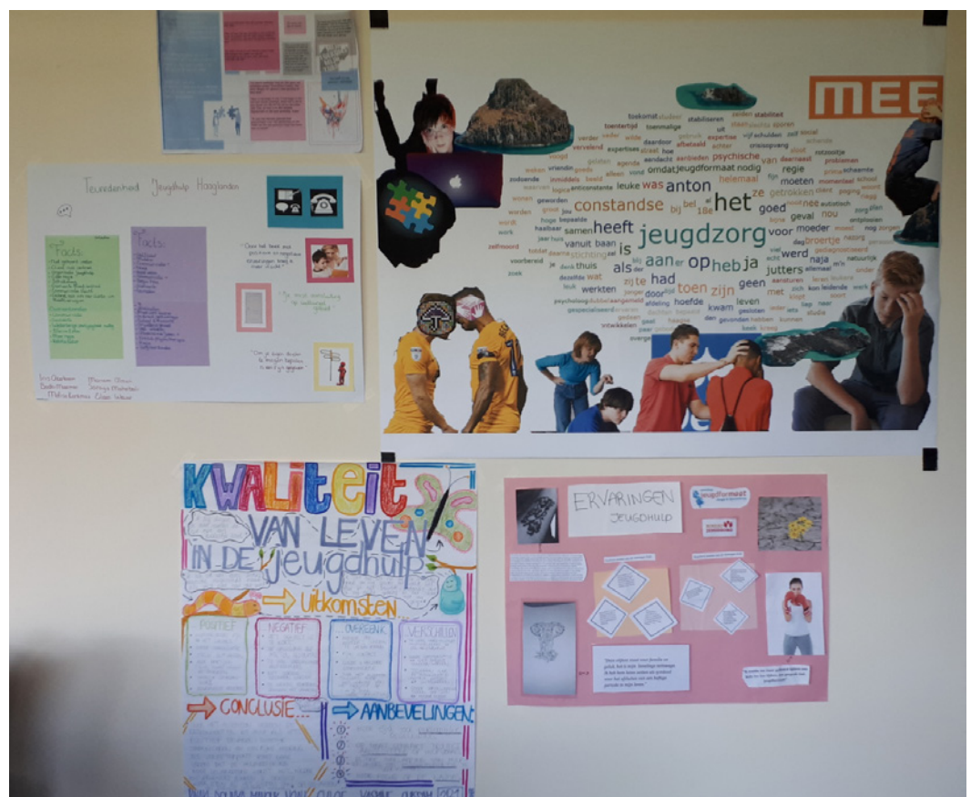
Afbeelding 1. Posterpresentaties van de studenten Social Work