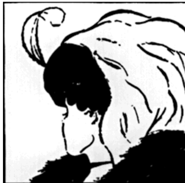
Old woman or young lady?